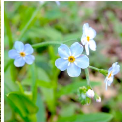
2. Äkta förgätmigej